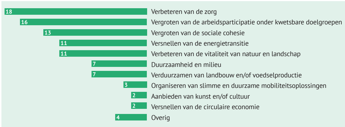
Figuur 2: Belangrijkste maatschappelijke missie van de organisatie (survey, n=99).

Ondernemingen in de Betekeniseconomie hebben als doel een maatschappelijk probleem op te lossen of maatschappelijke waarde te creëren. Uit de online vragenlijst blijkt dat organisaties binnen de Betekeniseconomie actief zijn op verschillende maatschappelijke vraagstukken. Gevraagd naar de belangrijkste maatschappelijke missie van de organisatie werden het verbeteren van de zorg, het vergroten van de arbeidsparticipatie en het vergroten van de sociale cohesie het meest genoemd (figuur 2). Vaak worden verschillende maatschappelijke thema's gecombineerd.