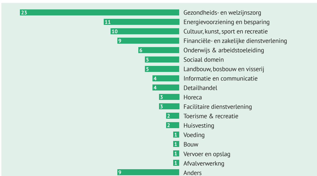
Figuur 3: Belangrijkste sector waarin de ondernemingen actief zijn (survey, n=99).

Ondernemingen in de Brabantse Betekeniseconomie zijn in verschillen sectoren actief (figuur 3). De meeste ondernemingen zijn actief in de gezondheids- en welzijnszorg; de energievoorziening; de financiële- en zakelijke dienstverlening; en cultuur, kunst, sport en recreatie. Bijna de helft is actief in twee of meer sectoren. Dit beeld komt overeen met de Nederlandse social enterprise sector. Sociale ondernemingen in Nederland zijn het vaakst actief in de gezondheids- en welzijnszorg, de energievoorziening en de financiële- en zakelijke dienstverlening. 7